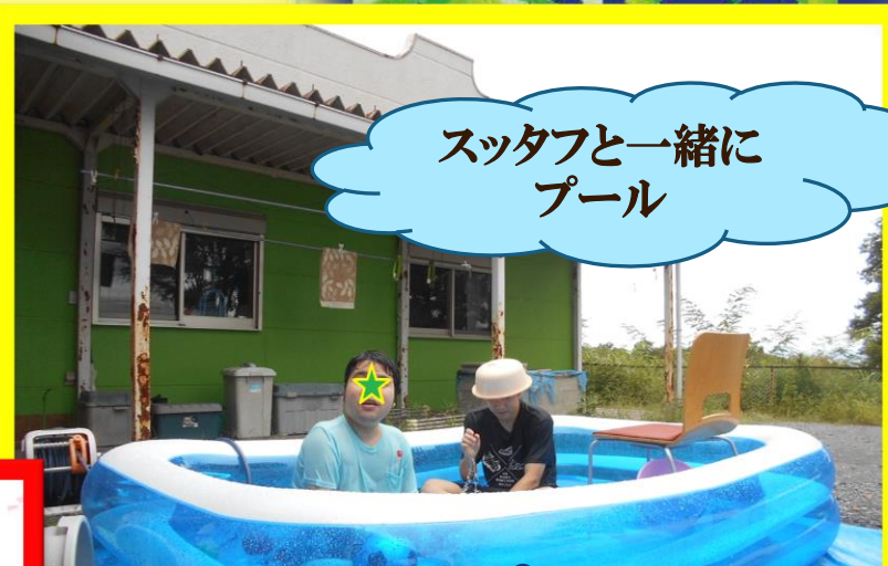
スタッフと一緒に プール